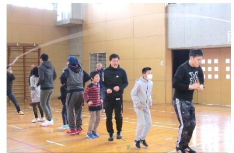
昨年のなわとび大会の様子

令和3年2月28日(日)に開催を予定しておりましたが、「第45回元祖親子なわとび大会」は実行委員会で検討した結果、新型コロナウイルス感染拡大予防の観点から開催中止を決定いたしました。参加の皆様のご健康と安全面を考慮した結果、誠に残念ですがご理解のほどよろしくお願いたします。